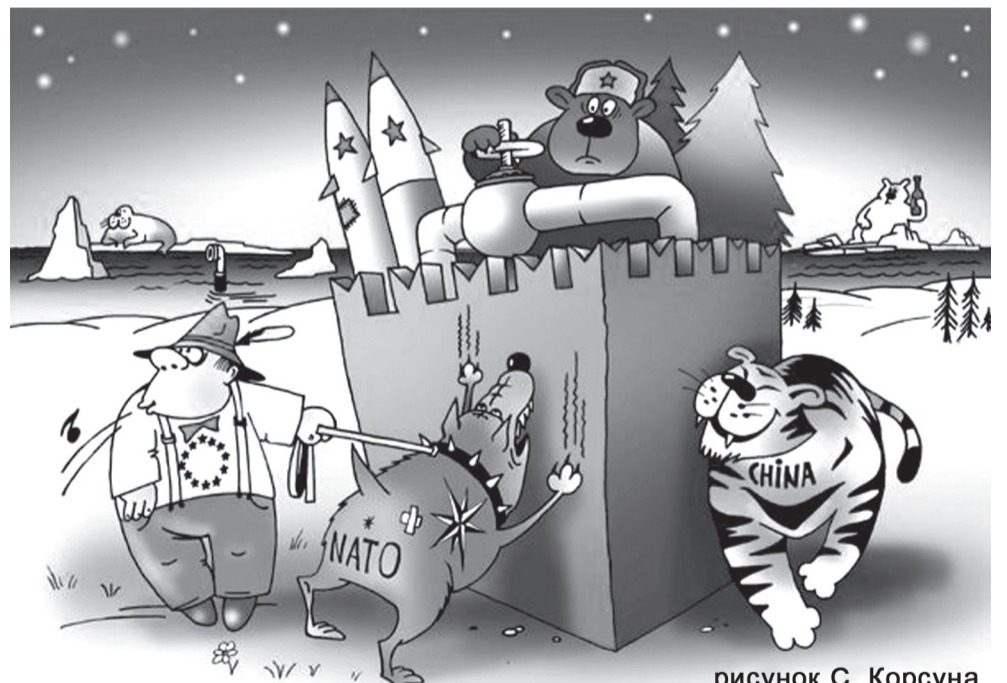
рисунок С. Корсуна

Армии достаточно добросовестных генералов, пытающихся хоть как-то ее спасти. И когда мы спрашиваем у этих людей, какая армия нам нужна, чтобы обеспечить защиту наших рубежей, нам называют цифру 4 млн. А сегодня Госсовет и верховный главнокомандующий подписывают директиву - 1 млн, и исходя из этой цифры, начинают кроить армию.